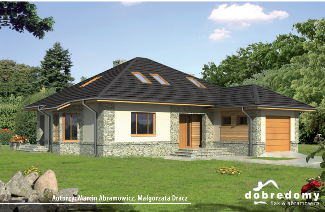
Autorzy: Marcin Abramowicz, Małgorzata Dracz

Powierzchnia użytkowa 126,0 m 2 + garaż 19,3 m 2 + strych 5,6 m 2