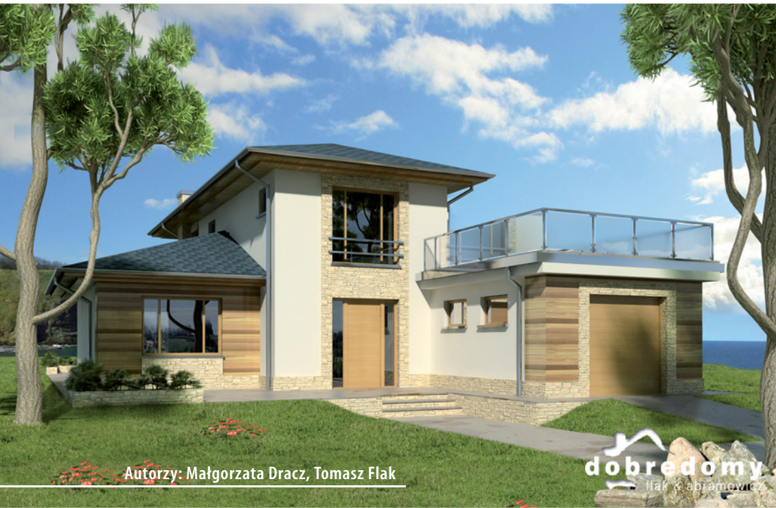
Autorzy: Małgorzata Dracz, Tomasz Flak