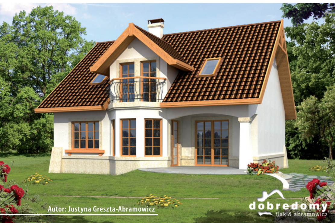
Autor: Justyna Greszta-Abramowicz