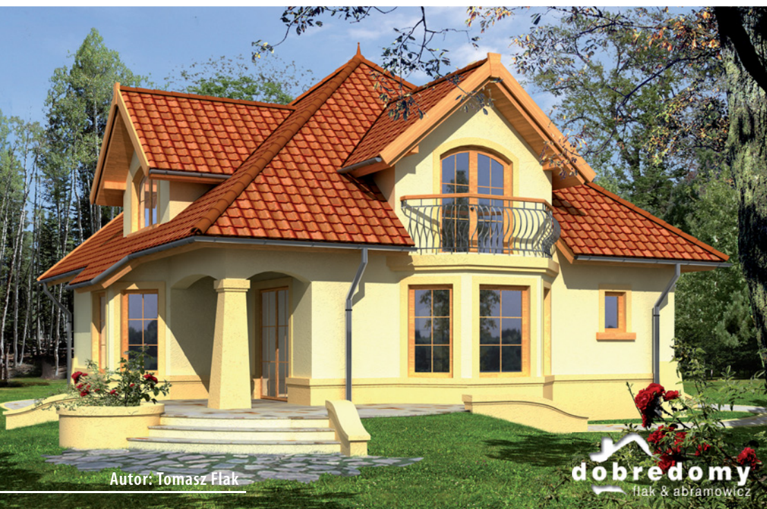
Autor: Tomasz Flak

Powierzchnia użytkowa 123,5 m 2 + pom. gosp. 8,6 m 2 + garaż 18,7 m 2