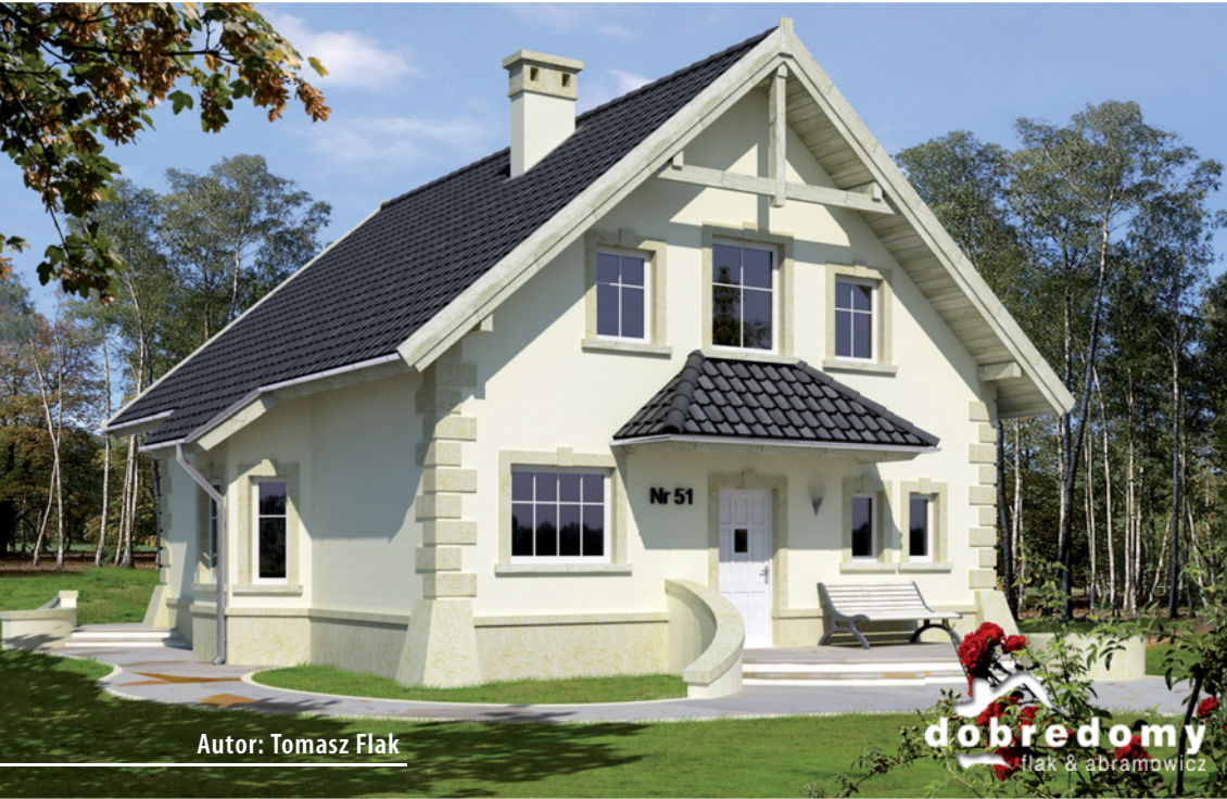
Autor: Tomasz Flak