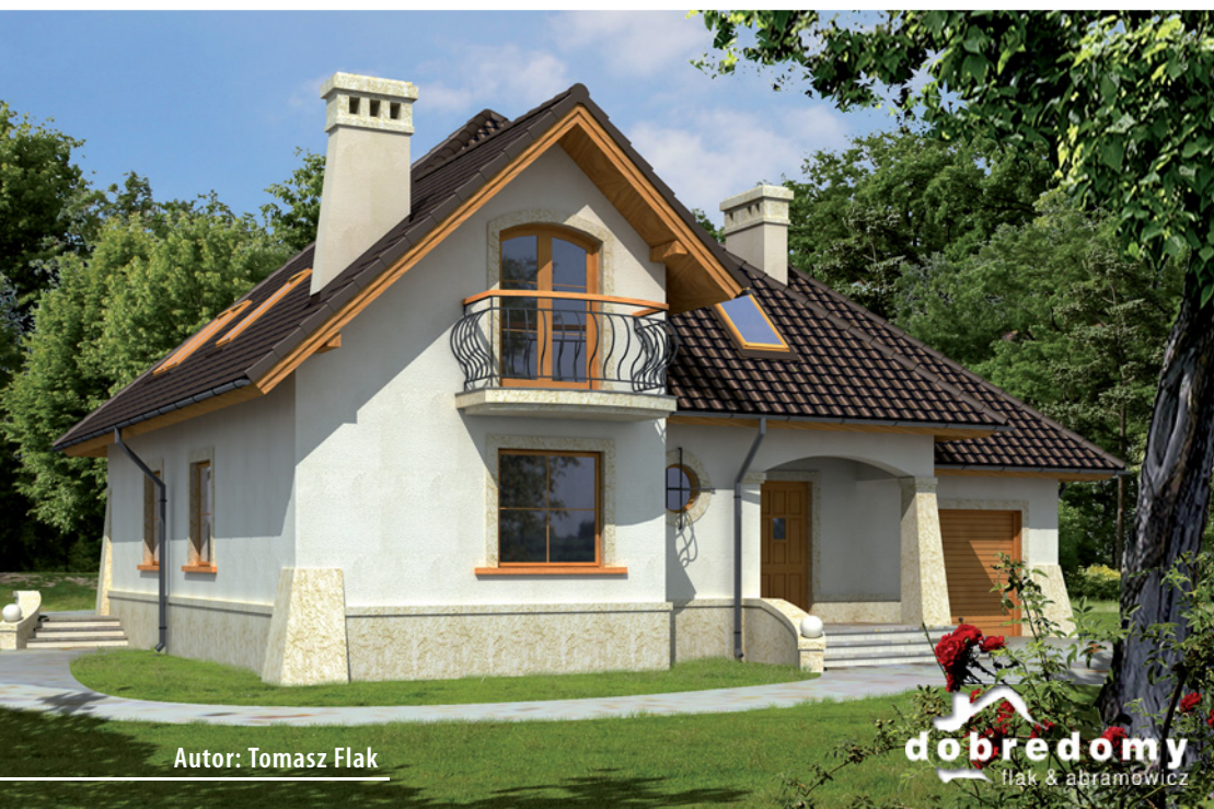
Autor: Tomasz Flak