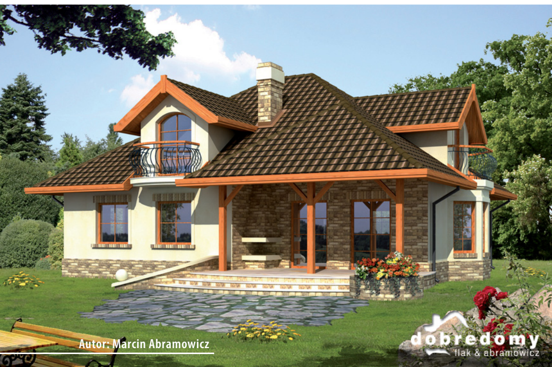
Autor: Marcin Abramowicz