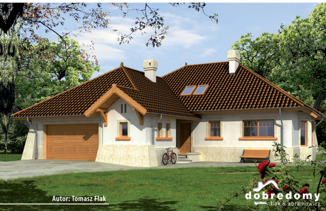
Autor: Tomasz Flak