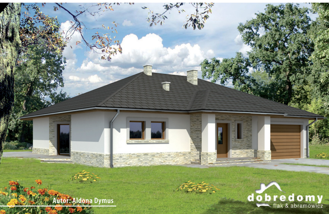
Autor: Aldona Dymus

Powierzchnia użytkowa 135,3 m 2 + pom. gosp. 4,6 m 2 + garaż 31,8 m 2