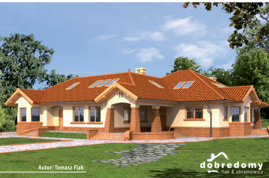
Autor: Tomasz Flak