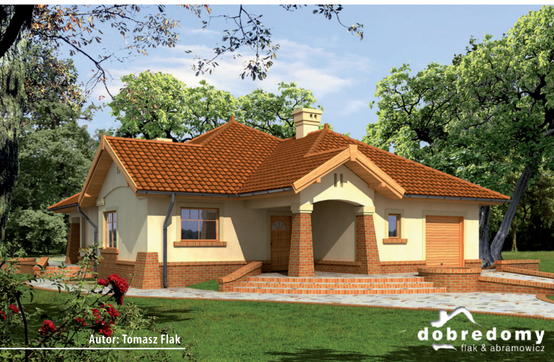
Autor: Tomasz Flak